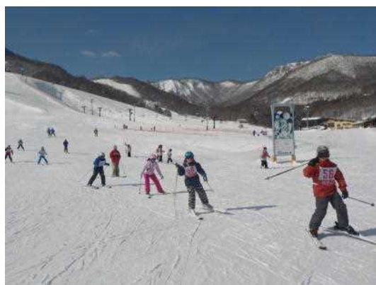
気持ちよく滑る子どもたち

1月20日(金)に会津高原だいくらスキー場で、4～6年生のスキー教室が行われました。当日は、天気にも恵まれ、とても素晴らしいロケーションの中で、町スキークラブの方やたくさんの保護者の皆様の御協力により、安全に楽しくスキーをすることができました。また、雪質も最高で、スキーの技術も格段に向上したように感じました。