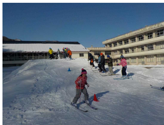
うまく曲がりながら滑る3年生

毎年、ボランティアで作業していただき、地域の皆様の支えによって子どもたちが育てられていることを改めて強く感じました。本当にありがとうございました。