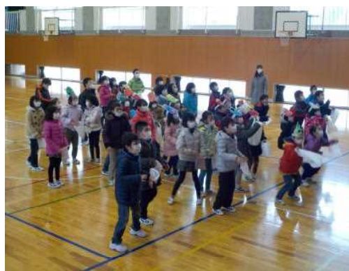
豆を拾う1・2・3年生